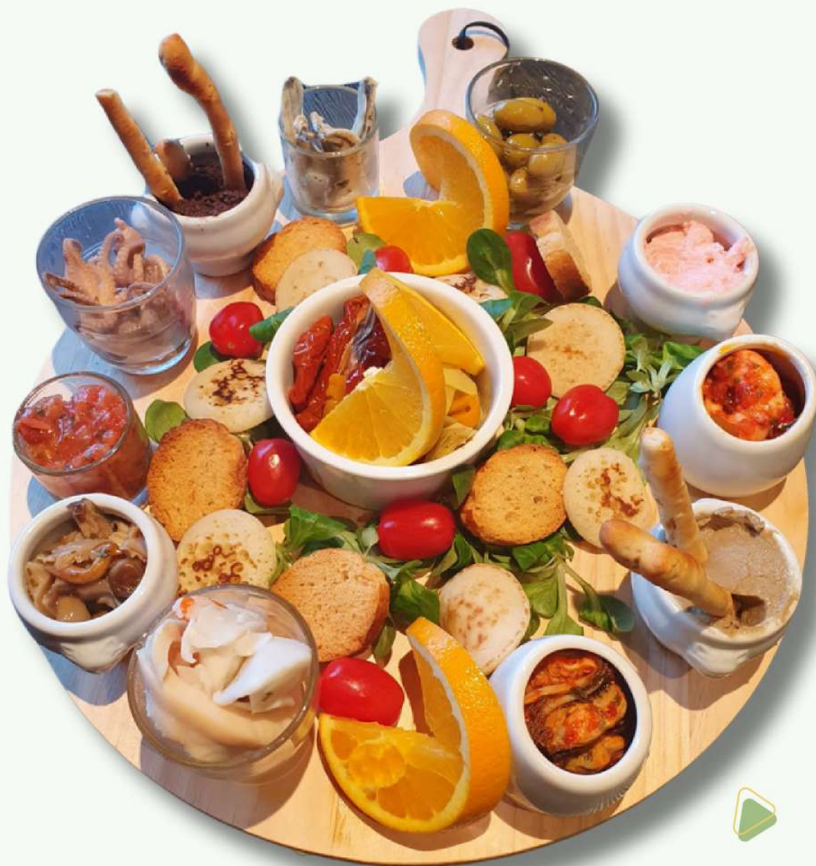
Planche du Pêcheur